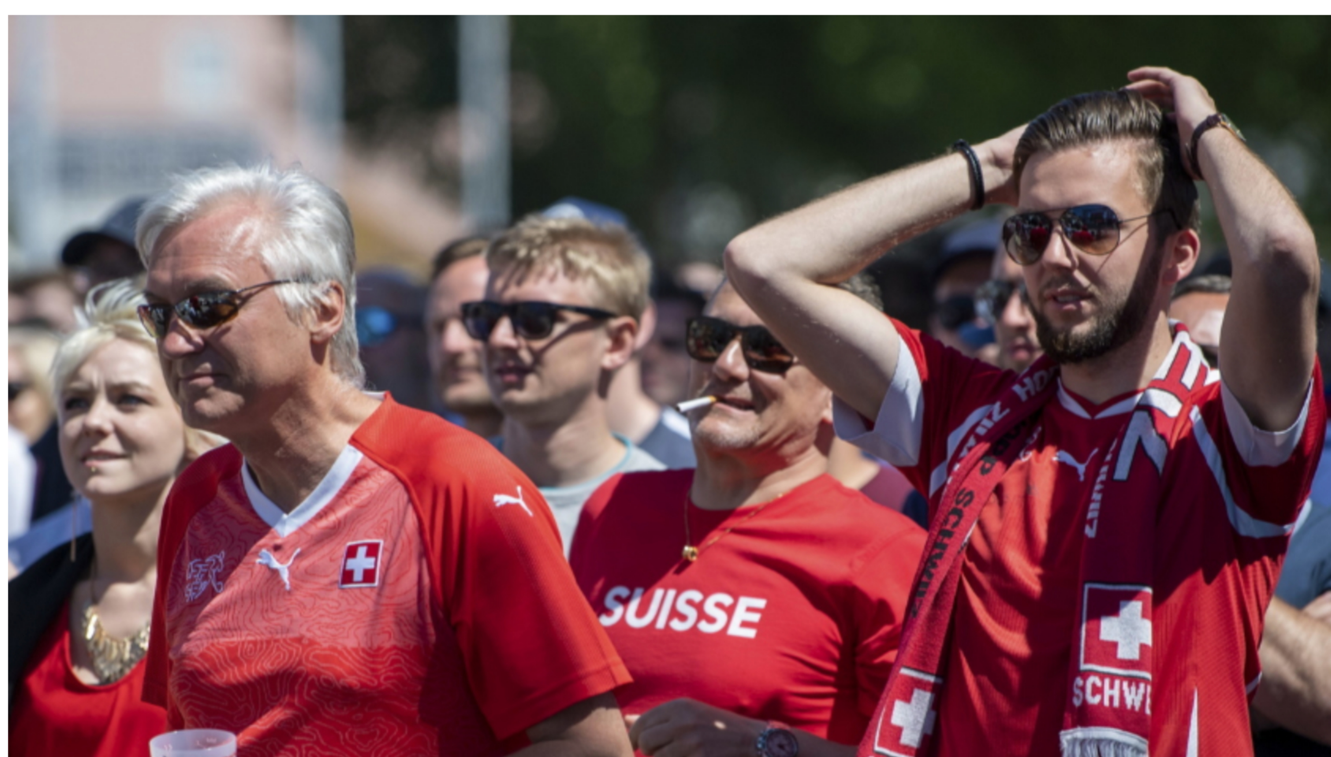
Les organisateurs doivent s'adapter aux mesures liées au Covid. De ce fait, peu de demandes ont été enregistrées dans le canton.

L'Euro de football commence ce soir. Cette année, les organisateurs de fan zones doivent s'adapter aux mesures liées au Covid.